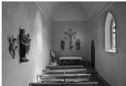
Ein wenig bekanntes Juwel im Hinterland des Bodensees ist die Loretto-Kapelle bei Illwangen mit ihrer barocken Innenausstattung.